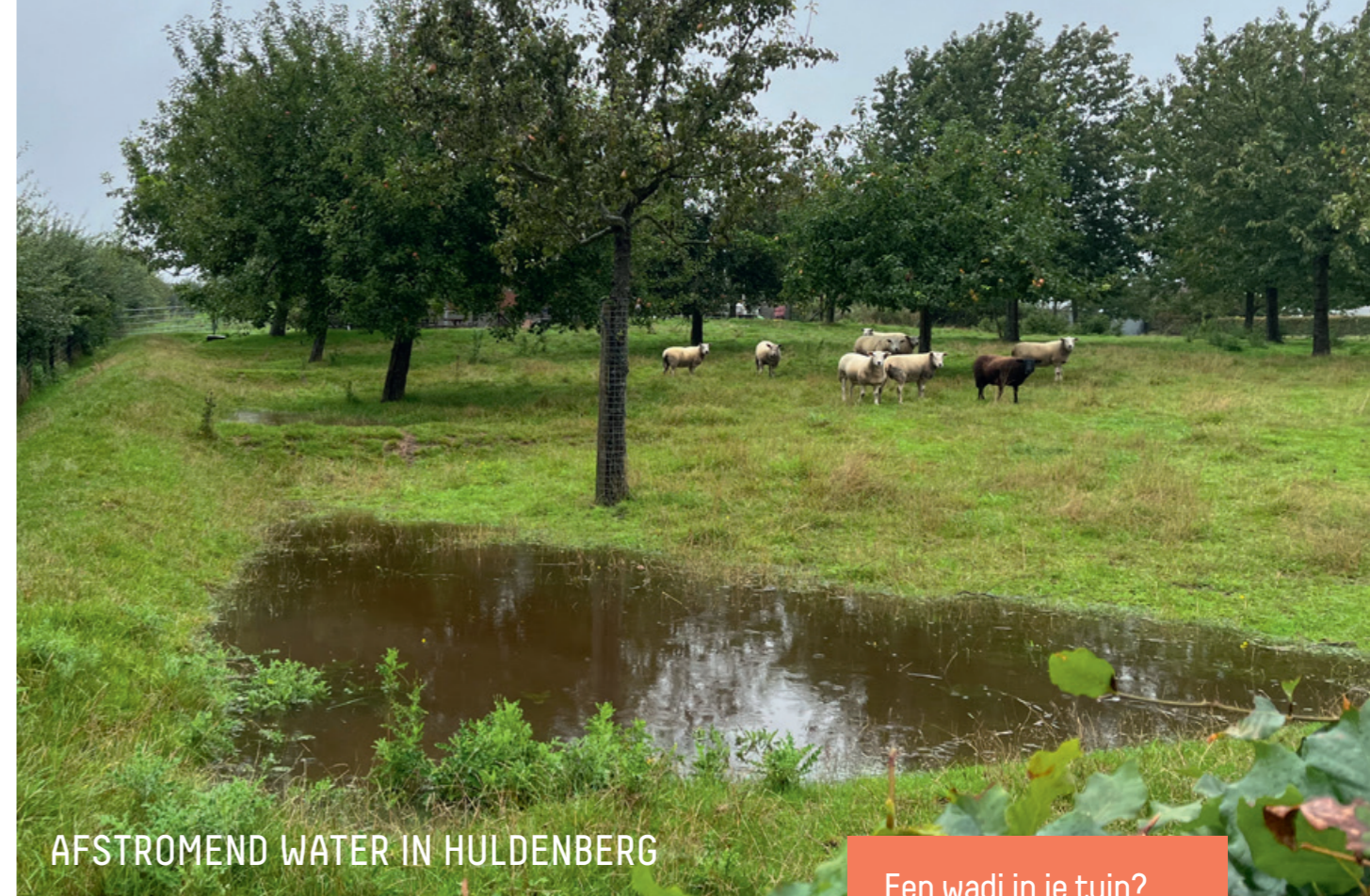
AFSTROMEND WATER IN HULDENBERG