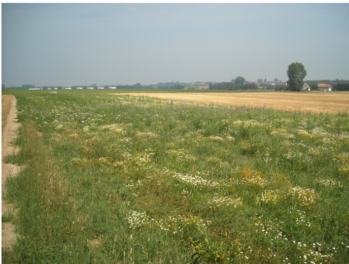
Foto: Voor Blauwe kiekendief geschikte brede ruigtestroken doorheen een grootschalig akkergebied.

Brede ruigtestroken (> 10 m) verschaffen dekking aan potentiële prooien en dienen de Blauwe kiekendief tot jachtgebied. Dergelijke stroken kunnen worden aangelegd in het kader van een agrarisch natuurbeheer ofwel aansluiten op een ander soort randenbeheer (bv. in functie van erosiebestrijding of waterbuffering).