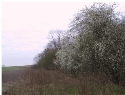
Foto: Voor Braamsluiper geschikt doornig struikgewas.

Voor Braamsluiper geschikte heggen en houtkanten zijn grillig opgebouwd en bestaan grotendeels uit laag blijvende doornstruiken van verschillende soorten die regelmatig worden afgewisseld en doorbroken met hoog opgaande doornstruiken en een enkele boom.