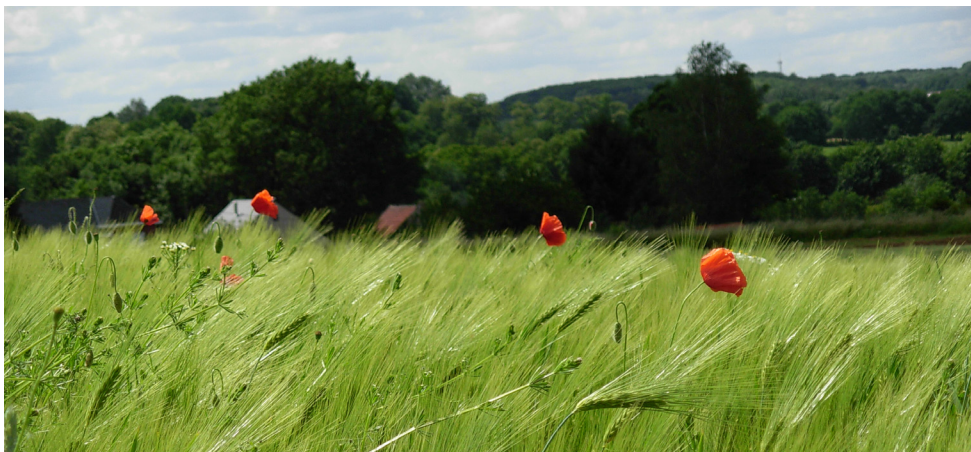
Foto: Enkel gevarieerde kruidenrijke akkers, braaklanden en graslanden verschaffen voldoende dekking en nestgelegenheid aan de Kwartel.

Graanakkers, luzerne- en klavervelden krijgen als broedgebied de voorkeur. Vochtige bodems worden eerder dan droge bodems uitgezocht. Akkers met hakvruchten worden na de oogst graag door Kwartels opgezocht. Bij een natuurgericht akker- en graslandbeheer hoort ook een stopzetting, extensivering en/of gerichte(re) toepassing van bestrijdingsmiddelen.