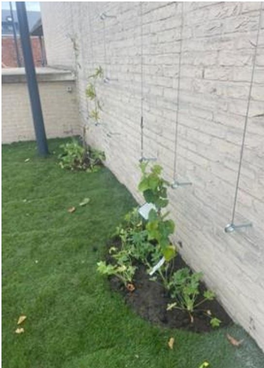
Figuur 3: foto van een klimhulp met klimplant aan het gemeentehuis van Tremelo