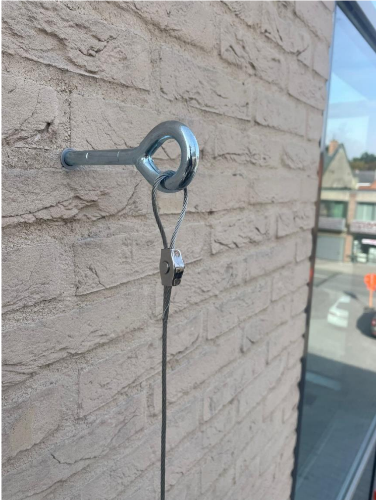
Figuur 4: Detail schroefoog klimhulp